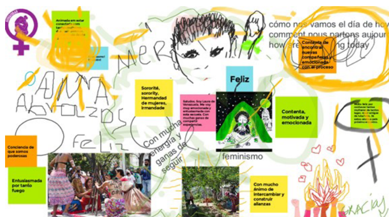
Actividad de Jamboard: "¿cómo nos sentimos hoy?"

En la sesión inaugural se expuso la importancia de la interpretación en la escuela desde el principio de la justicia lingüística y conocimos a las intérpretes que nos acompañarán a lo largo de las sesiones. También aprendimos a utilizar, colectivamente, las herramientas virtuales con las que trabajamos en la escuela, conocer quiénes son las compañeras y los compañeros que participarían en la formación, el programa y la agenda de las próximas sesiones. Además, realizamos algunos ejercicios para entender lo que se esperaba del curso y vimos algunos videos como preparación para los temas que íbamos a tratar. Al final de la jornada, realizamos dos actividades con las herramientas virtuales como forma de aprender a utilizarlas colectivamente. Una se realizó para demostrar cómo funciona la pizarra virtual Jamboard y la otra para que las participantes compartieran sus expectativas acerca de la Escuela en Mentimeter.