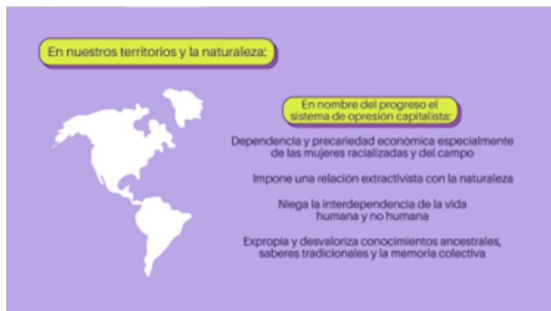
Sistematización de los resultados del trabajo en grupos

EN EL ESTADO Y SUS POLÍTICAS PÚBLICAS SEÑALAMOS → Los estados y sus gobiernos están atravesados por el sistema de opresiones múltiples. → Los estados, sus políticas públicas y leyes están al servicio del sistema de opresiones múltiples. Esto se constata en leyes que no reconoce la autonomía de los cuerpos de las mujeres, como en aquellas que privilegian el expolio de las transnacionales sobre bienes comunes como el agua o la tierra. → Incluso en estados con gobiernos progresistas existen brechas y límites en la relación Estado y movimientos sociales y sus luchas.