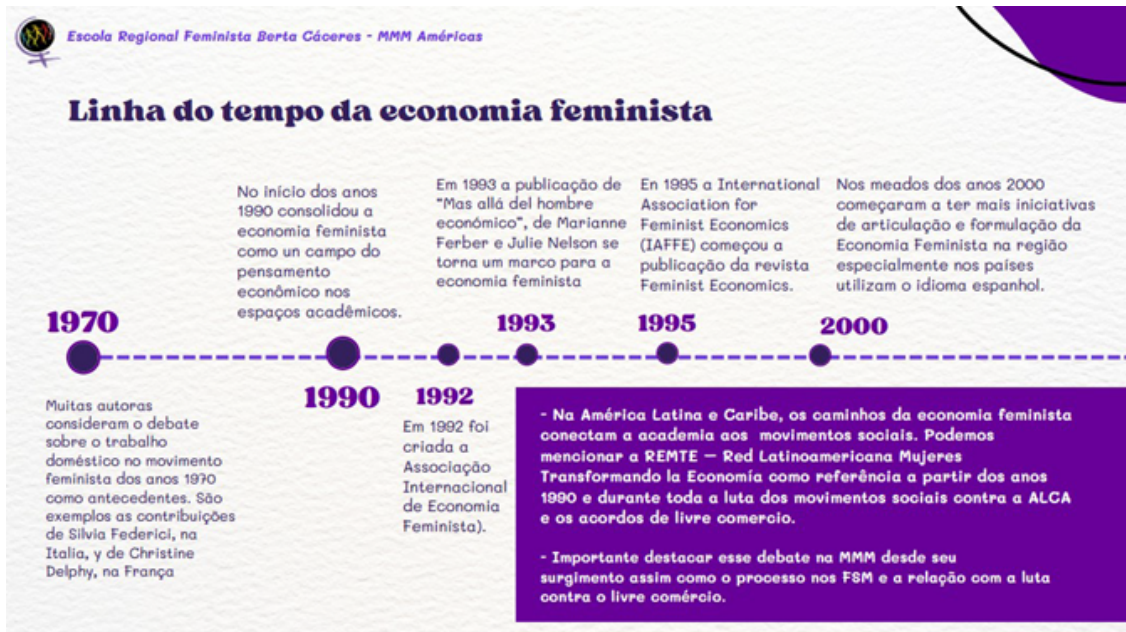
Cronología de la economía feminista

En América Latina y el Caribe los caminos de la economía feminista conectan el pensamiento académico con los movimientos sociales; se menciona a la Red Latinoamericana de Mujeres Transformando la Economía REMTE como referente a partir de los años 90'. También se destaca la construcción de este debate en la Marcha Mundial de Mujeres desde su surgimiento.