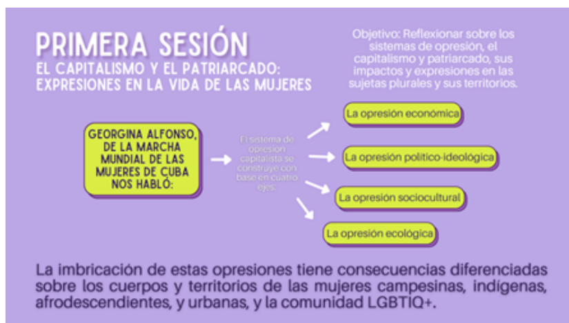
Síntesis visual del video proyectado