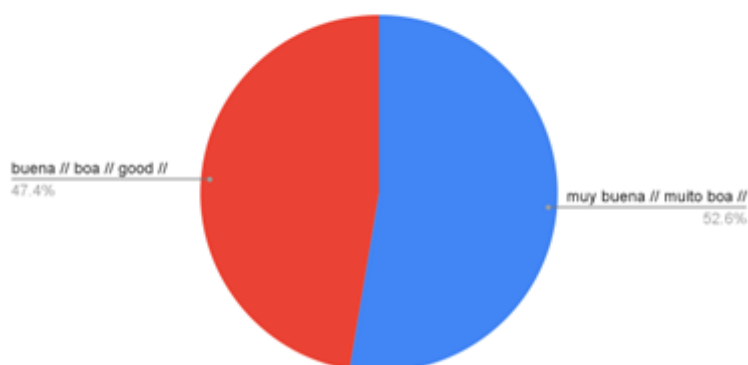
Recuento de ¿Cuál es tu opinión sobre la facilitación y las herramientas de comunicación utilizadas en la Escuela? // Sua

Las participantes consideran que la facilitación y las herramientas de comunicación utilizadas en la escuela fueron buenas.