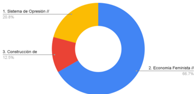
Recuento de ¿Cuál fue el módulo que más te inspiró? // Qual módulo te inspirou mais? // Which module inspired you the

La economía feminista fue el módulo más señalado por las participantes del curso. Entre los temas que les gustaría seguir desarrollando, en orden de mayor a menor interés, estuvieron: Economía feminista: enfoques y corrientes de pensamiento (13 votos), Herramientas para la construcción y fortalecimiento del movimiento (12 votos), Acumulados y caminos de la economía feminista desde la MMM Américas (10 votos), Propuestas globales y territoriales de transformación desde la economía feminista (10 votos) y El funcionamiento de los sistemas de opresión en los cuerpos y territorios (7 votos).