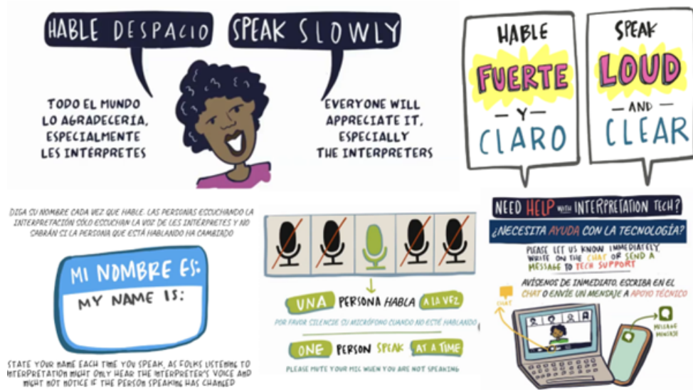
Material de apoyo con orientaciones para el turno de palabra

Para construir una Escuela feminista en cuatro idiomas, con tanta variedad cultural y formas de expresión, también hay que tener en cuenta las propias características de la interpretación, es decir, es necesario un ejercicio colectivo para hablar a un ritmo más lento, con pausas, evitando siglas y acrónimos, por ejemplo. También se necesitó un diálogo permanente entre el GT metodológico, el equipo técnico y el equipo de interpretación para garantizar que las intérpretes pudieran acceder previamente a los materiales programados para las sesiones, como presentaciones de las ponentes, videos, textos y poemas, de